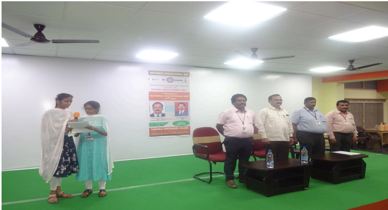
Dignitaries on the dais standing for the prayer song