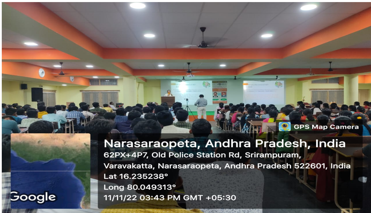
Resource person delivering a session to the student gathering